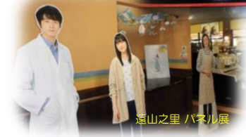
遠山之里 パネル展